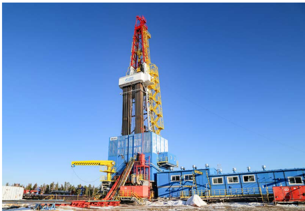
Буровой станок — один из 18 на Ковыктинском месторождении

Приоритетом в работе предприятия, особенно в реалиях пандемии коронавируса, остается сохранение жизни и здоровья каждого сотрудника. В мае «Газпром добыча Иркутск» стал победителем городского и регионального конкурсов по охране труда в сфере добычи полезных ископаемых по итогам 2020 года.