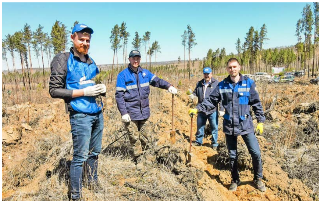
14 мая в Иркутском районе работники нашей компании высадили 400 саженцев сосны с открытой корневой системой в рамках Международной акции «Сад памяти»

Сергей Солоненко Фото из архива компании