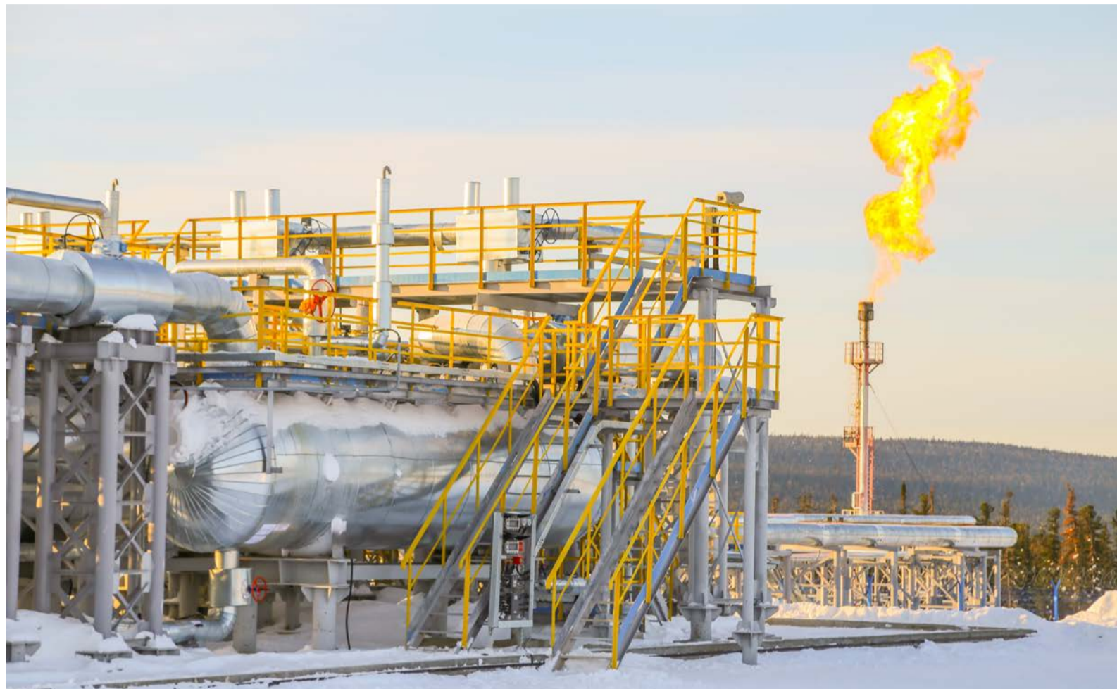
На Газовом промысле Ковыктинского месторождения