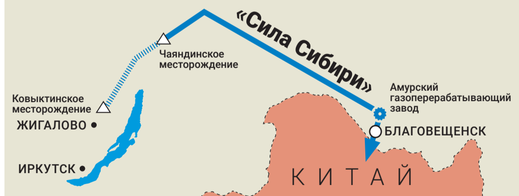
«Сила Сибири» — крупнейшая система транспортировки газа на Востоке России. Протяженность — около 3000 км, диаметр — 1420 мм, рабочее давление — 9,8 МПа, экспортная производительность — 38 млрд куб. м в год. Ковыктинское месторождение — ресурсная база для проекта наряду с Чаяндинским в Якутии

7 сентября на Ковыктинском месторождении побывала рабочая группа во главе с заместителем Председателя Правления ПАО «Газпром» Олегом Аксютиным. Вместе с ним на площадку строительства установки комплексной подготовки газа УКПГ-2 приехали начальники нескольких