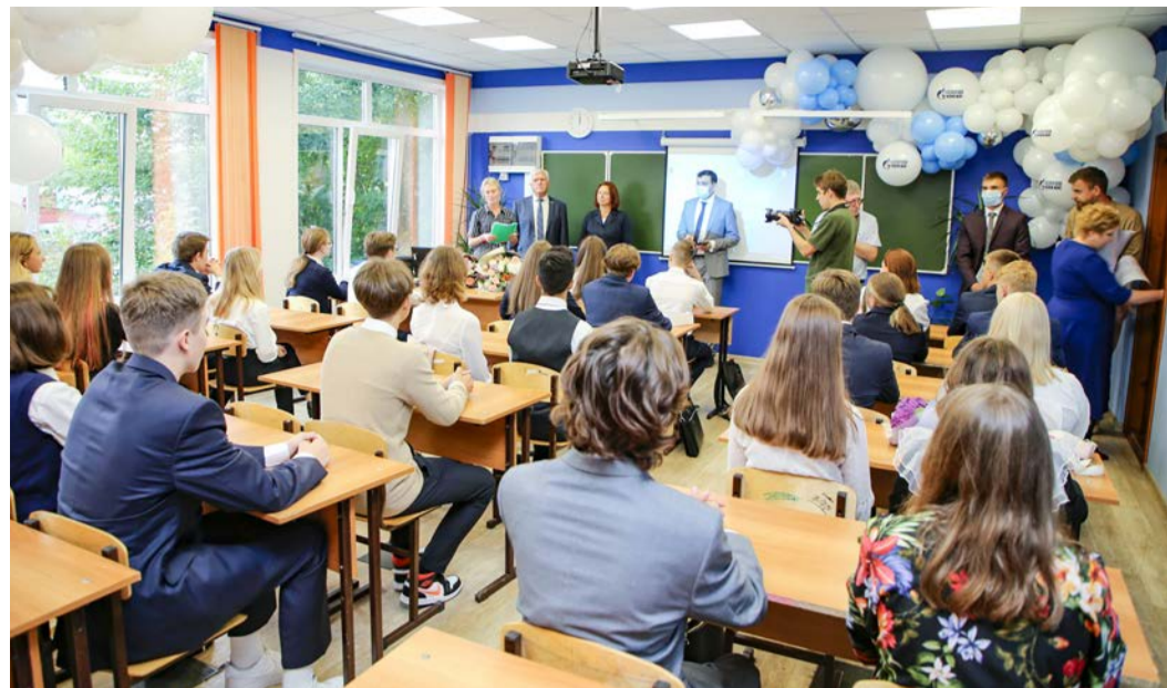
Во время встречи работников компании с учениками нового набора иркутского «Газпром-класса»

ройства месторождения углеводородов» и «Способ подготовки углеводородного газа к транспорту», а также на полезную модель «Устройство для изготовления предохранительных мембран». Кроме того, в 2021-м наши работники направили в Роспатент заявки на патентование предполагаемого изобретения «Способ предотвращения гидратообразования в системе сбора газа газоконденсатных месторождений» и «Способ подготовки природного газа к транспорту». Заявки находятся на экспертизе.