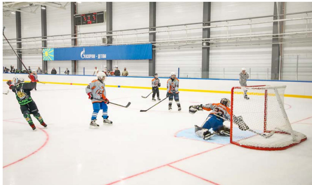
21 июля состоялось открытие физкультурно-оздоровительного комплекса в Тулуне, построенного на средства ПАО «Газпром»

Ко Дню Байкала был приурочен конкурс рисунка «Байкал глазами детей». С большим интересом и увлечением мы участвовали в мероприятии «Я художник — я так