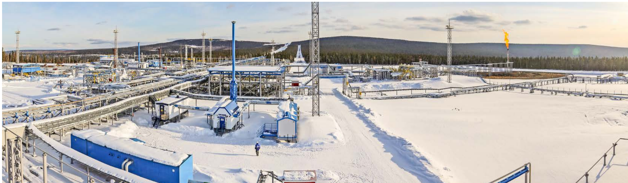
Площадка установки подготовки газа УПП-102