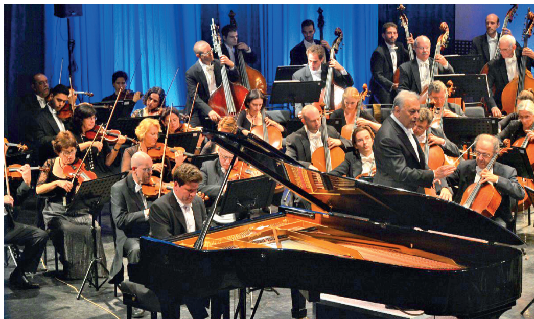
Каждый концерт фестиваля — яркое событие, настоящий праздник искусства

Концерт победителей и участников конкурса «Новые имена Приангарья» состоится 11 сентября в концертном зале Иркутской областной филармонии в рамках XIII Международного фестиваля академической музыки «Звезды