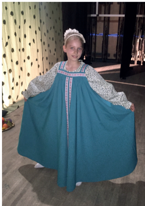
Алиса: «Театр — мое призвание!»