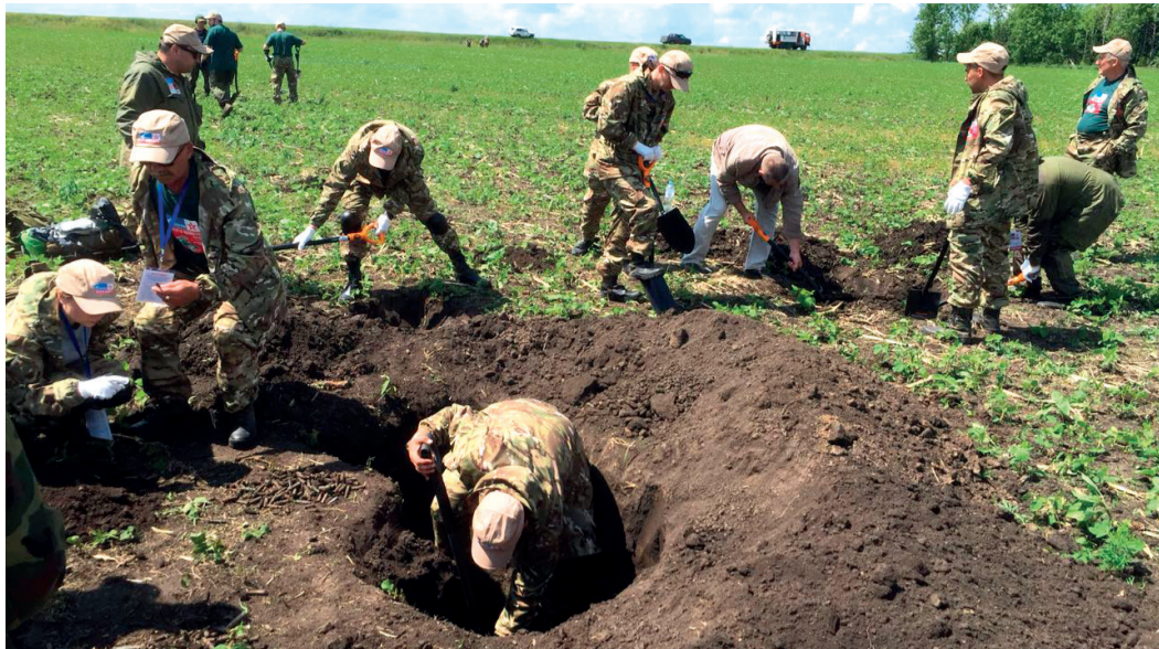
Земля в этих местах усеяна напоминаниями о сражениях. Можно копать совсем неглубоко и обнаружить тела советских солдат