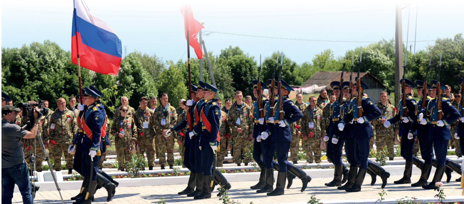
Во время церемонии перезахоронения, по меткому выражению поисковиков, все найденные бойцы встают в один строй с теми, кто поднял их из земли

— В один из дней мы нашли записку — в пластмассовом футляре был запечатан небольшой листок с именем и фамилией советского солдата-пехотинца. Бумага была в хорошем состоянии — как будто законсервирована вре-