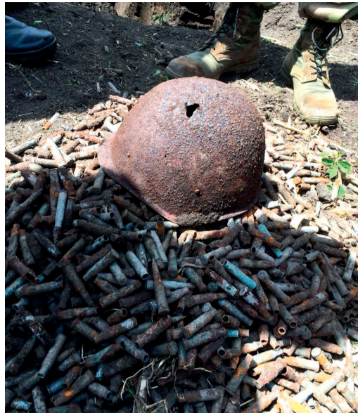
Горы поднятых из земли стреляных гильз, неразорвавшихся гранат, пробитых касок, частей оружия красноречиво говорят о том, насколько тяжелой ценой далась нашему народу Великая Победа