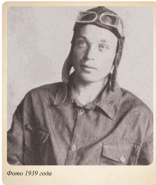
Фото 1939 года