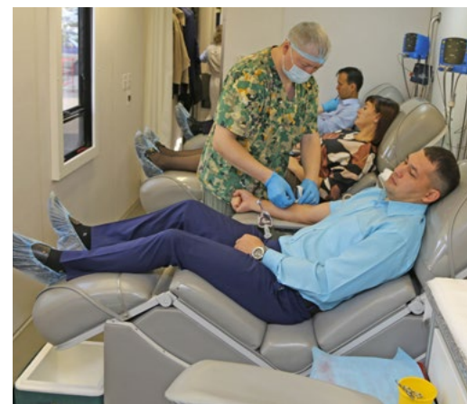
Акция «Я — донор» с участием иркутских газовиков в этом году состоялась дважды

2 июня работники компании вместе с семьями — всего более 50 человек — стали участниками федеральной экологической акции «Марафон рек». Газовики провели