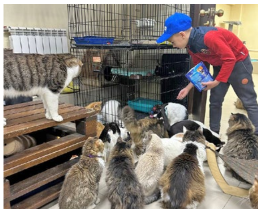
Наши сотрудники вместе с семьями по выходным навещают питомцев в приютах для бездомных животных