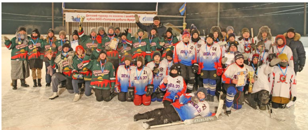
Хоккейный турнир на кубок ООО «Газпром добыча Иркутск» проводится в Магистральном с 2014 года

— Мой отец приехал в Магистральный в числе первостроителей БАМА в 1974 году, мы с мамой — годом позже. В хоккей здесь играют все время в любые морозы. Люди были и есть эмоциональные и от-