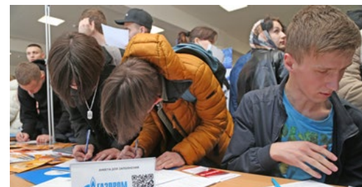
На ярмарках вакансий и днях карьеры сектор «Газпром добыча Иркутск» — всегда один из самых востребованных