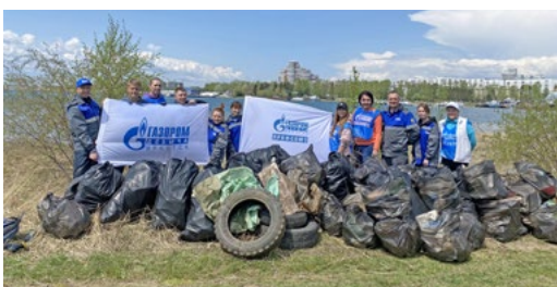
2 июня мы принимали участие в федеральной экологической акции «Марафон рек»