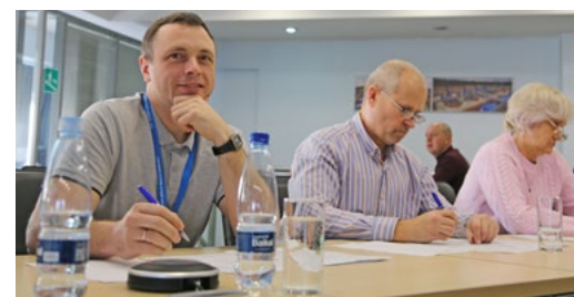
В этом году в компании впервые была организована площадка международного «Географического диктанта»