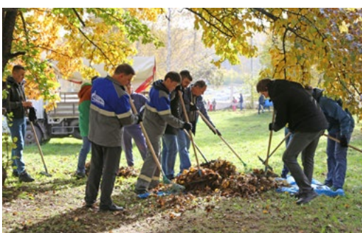
Субботники – важная часть нашей корпоративной жизни