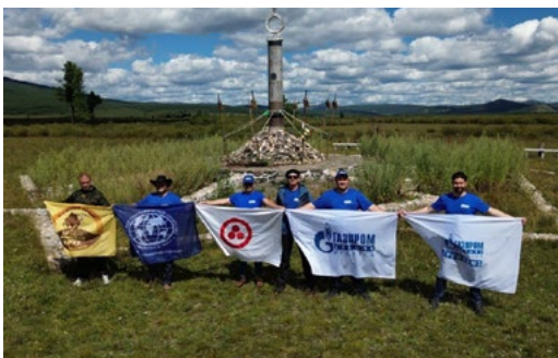
В августе при поддержке компании состоялась этнографическая экспедиция «По следу тюрка. Монголия-2023»