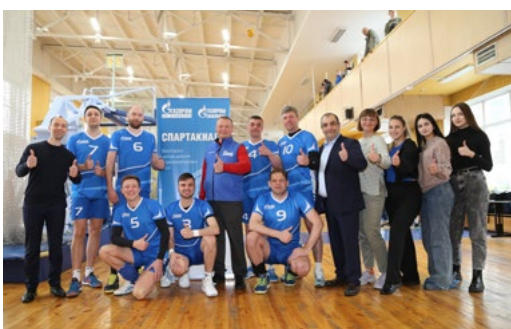
20 мая стартовала первая Спартакиада Иркутского центра добычи и транспортировки газа. Наша сборная заняла первое место в общекомандном зачете