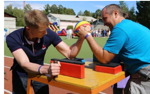
Во время корпоративного праздника 2 сентября можно было помериться силами с коллегами из разных компаний Некоммерческого партнерства «Газпром на Байкале»

Сергей Солоненко Фото автора и из архивов компании и ПАО «Газпром»