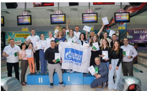
В турнире по боулингу приняли участие 78 человек