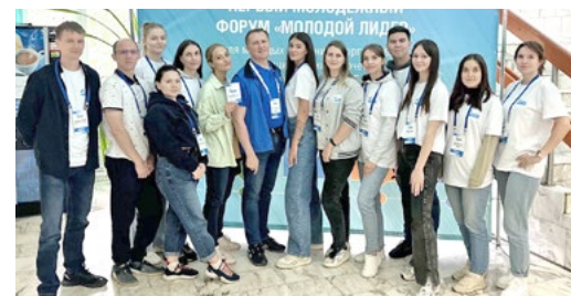
На первый форум «Молодой лидер» приехали участники со всей страны