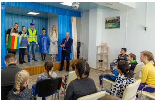
Представители компании показали воспитанникам Иркутского детского дома-интерната № 1 экологический спектакль «Вторая жизнь отходов»