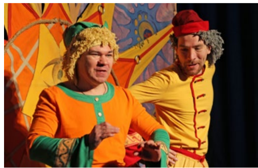
ПОЧЕТНАЯ МИССИЯ — ДАРИТЬ РАДОСТЬ СТР. 4