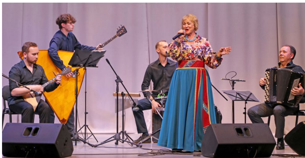
Концерты ансамбля «Байкал-квартет» стали одним из самых ярких творческих событий для жителей Жигалово в этом году

Зрителям представили две программы. «Со мною вот что происходит» — концерт для взрослых, в котором прозвучали песни на стихи нашего земляка известного поэта Евгения Евтушенко. Во время детской программы «Территория музыки» юная публика познакомилась с яркими музыкальными