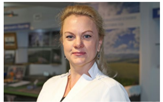
СЕМЬ ПРАВИЛ ЗАЩИТЫ ОТ ОРВИ СТР. 4