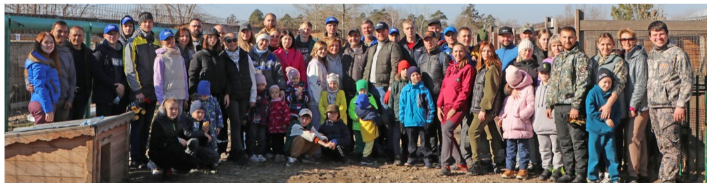
Акции «Выходные добра» с каждым разом становятся все более массовыми. 21 октября в ангарском приюте «Помоги выжить» побывало более 60 сотрудников вместе с семьями