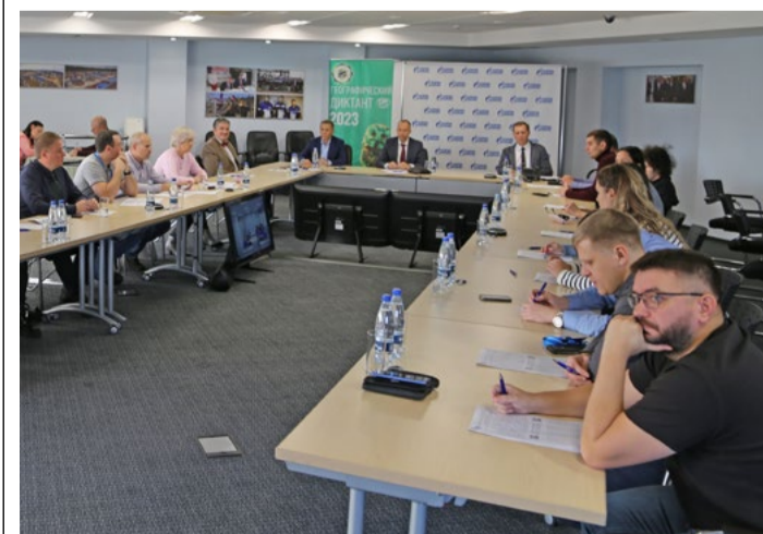
Участники диктанта ответили на 40 вопросов по географии России