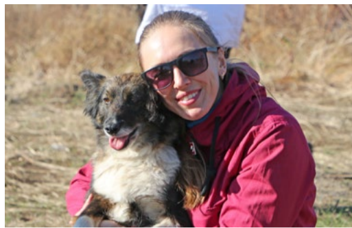
«ПРИЕЗЖАЙТЕ К НАМ ЕЩЕ!» СТР. 3