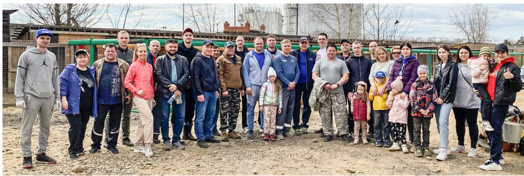
6 мая иркутские газовики провели субботник в ангарском приюте для собак «Помоги выжить»

«Иркутский газовик» постоянно рассказывает о волонтерской работе по оказанию помощи бездомным животным, в которой участвуют наши сотрудники. Сегодня — продолжение этой важной темы.