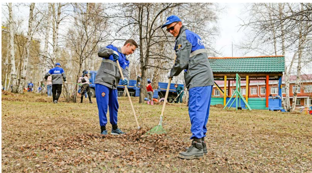
Субботники в иркутском детском доме № 1 мы проводим с 2012 года

Кроме того, параллельно с Иркутском субботник прошел и на производственных объектах Ковыктинского газоконденсатного месторождения.