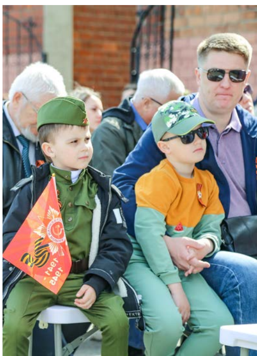
9 Мая — праздник, объединяющий поколения

9 мая у главного административного здания компании в Иркутске для коллективов Некоммерческого партнерства «Газпром на Байкале» состоялся концерт-митинг.