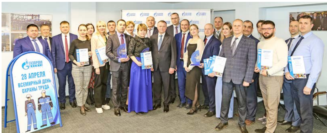
Во время награждения победителей и участников соревнования

— В соревновании приняли участие 17 подразделений компании. Оно состояло из двух этапов. На первом претенденты на победу представили заявки с 28 критериями. По результатам рассмотрения представленных заявок был рассчитан коэффициент производственной безопасности каждого участника. По итогам первого этапа для дальнейшего участия в соревновании