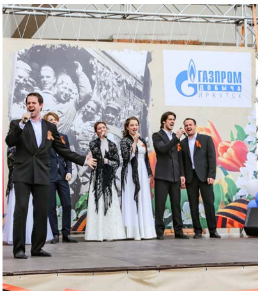
Артисты Иркутского драмтеатра исполнили поурри из песен военных лет

Участники экскурсий с большим интересом ознакомились с образцами оружия, военного обмундирования и техники. Все желающие сфотографировались в катапультном кресле, поговорили по полевому телефону и послушали патефон.