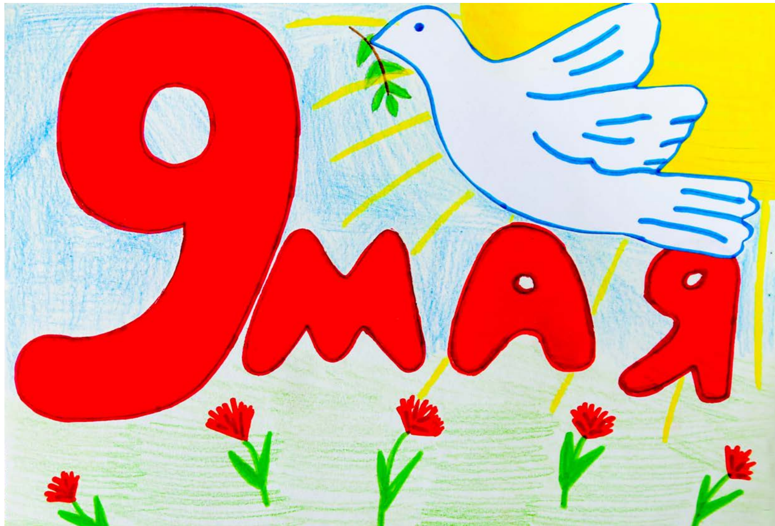
Одна из работ творческого конкурса «Наши самый главный праздник — День Победы». Подробности на стр. 3