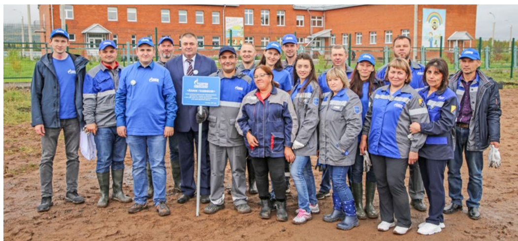
Высадка «Аллеи газовиков» в селе Тутура Жигаловского района. 1 сентября 2022 года