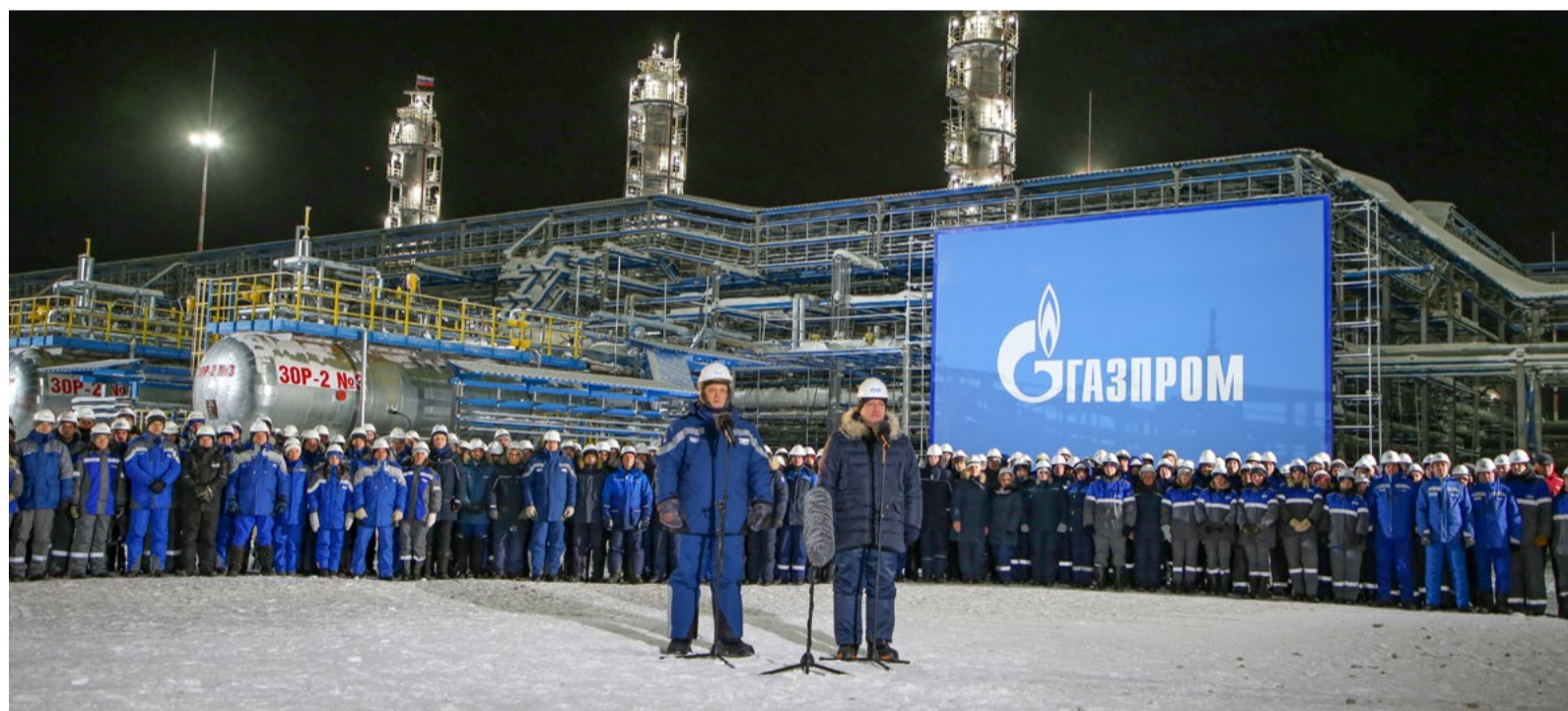
Во время торжественной церемонии запуска в работу Ковыктинского газоконденсатного месторождения. 21 декабря 2022 года