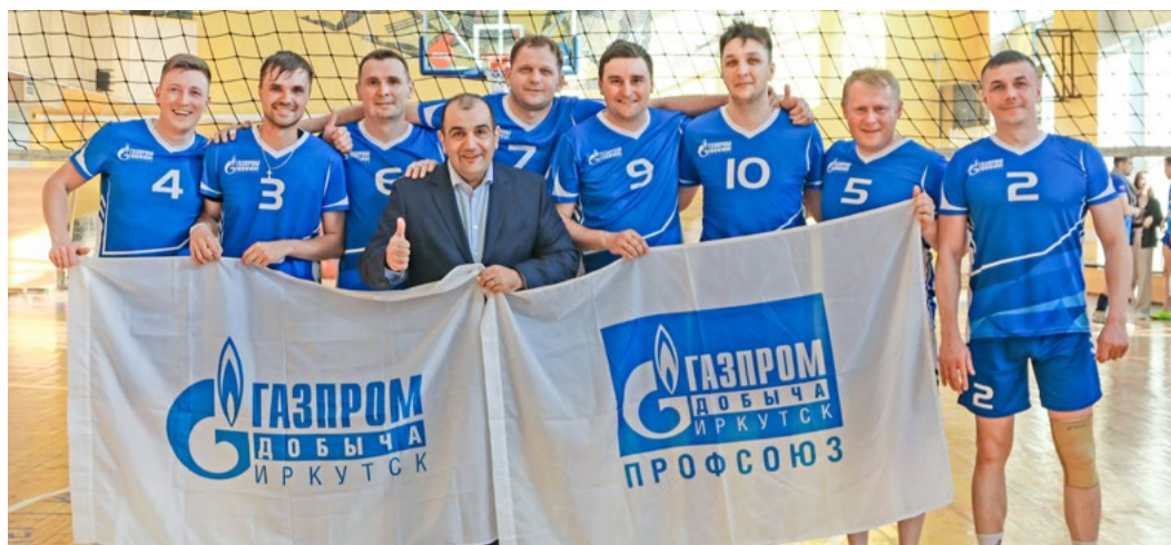
Во время волейбольного турнира I спартакиады среди участников Интегрированного проектного офиса «Ковыкта». 23 мая 2022 года