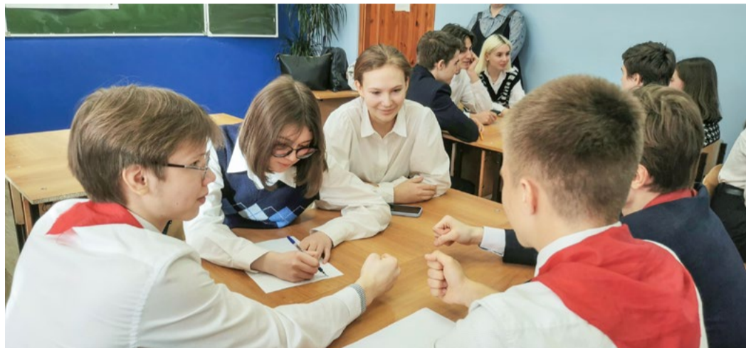
Ученики иркутского «Газпром-класса» принимают участие в викторине, организованной работниками нашей компании. 4 марта 2022 года