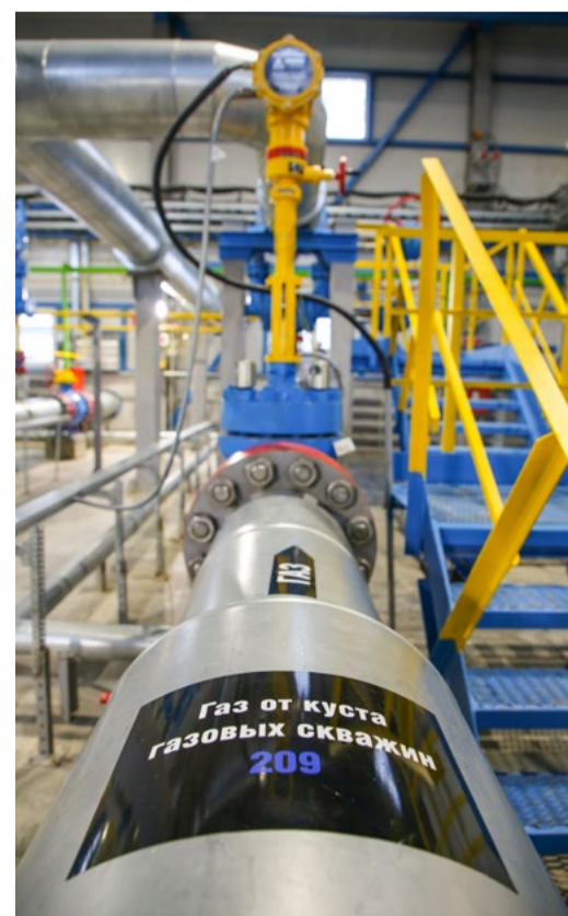
В блоке входных ниток и пробкоуловителей на УКПГ-2 Ковыктинского месторождения

Автор этих строк присутствовал на второй точке. Обстановка перед трансляцией была волнующей и вместе с тем бодрой и дружеской. Многие перед выходом на позицию звонили родным, друзьям и коллегам: «Включайте «Россию 24», нас сейчас будут показывать!»