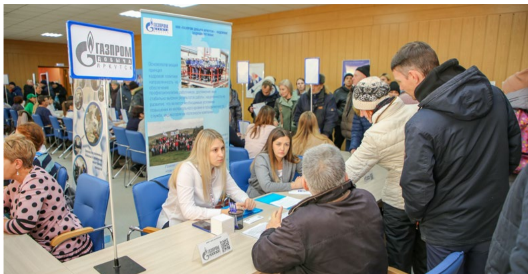
Ярмарка вакансий в Ангарске. 24 ноября 2022 года