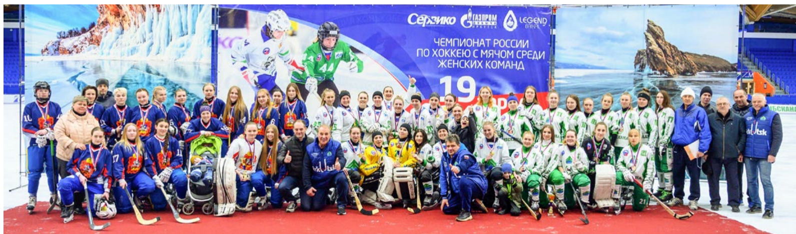
Женская команда по хоккею с мячом «Сибскана», спонсором которой является наше предприятие, в 2022 году стала чемпионом и обладателем Кубка России!

Сергей Солоненко Фото автора, Татьяны Глюк и из архива компании