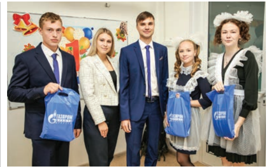
КЛАССНЫЙ ЧАС ПРО ГАЗ СТР. 4