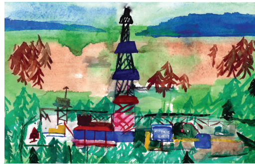
МЕРОПРИЯТИЯ КО ДНЮ ГАЗОВИКА СТР. 4