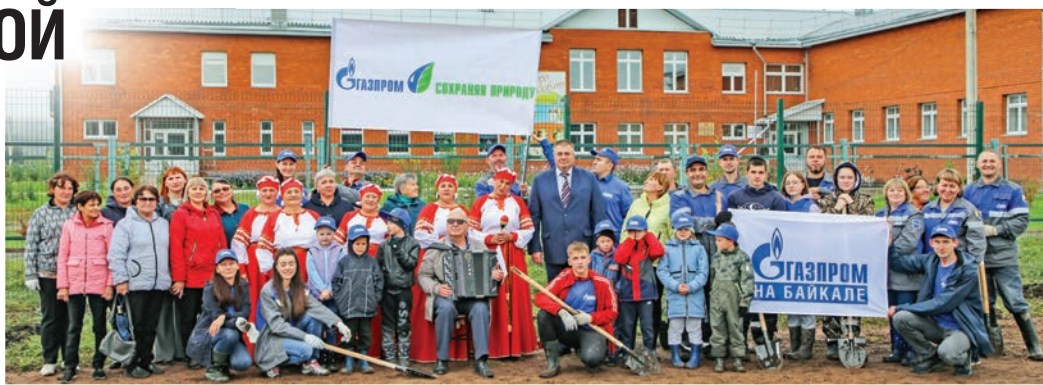
Когда делали общий снимок в селе Тутура, все вместе (включая фотографа) исполнили песню «Как здорово, что все мы здесь сегодня собрались»

Второго сентября в поселке Магистральном Казачинско-Ленского района и в селе Тутура Жигаловского района работники нашего предприятия и коллеги из компаний, входящих в Некоммерческое партнерство «Газпром на Байкале», высадили «Аллею газовиков». «Иркутский газовик» принял участие в экологической акции в Тутуре. Подробности — в нашем репортаже.