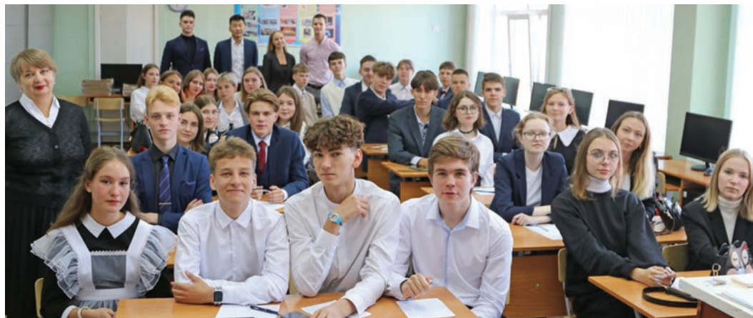
1 сентября в иркутской гимназии № 44