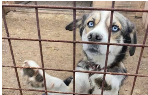
НУЖНА ПОМОЩЬ СТР. 3