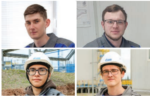
ПОНИМАНИЕ С ПОЛУСЛОВА СТР. 2