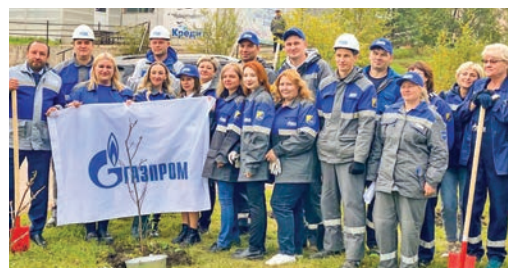
Участники высадки «Аллеи газовиков» в поселке Магистральном