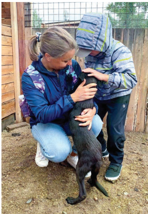
Важной частью посещения ангарского приюта было общение с его питомцами, которые так нуждаются в доброте и внимании

Они не подойдут и не попросят: «Помоги мне, пожалуйста». Все можно прочесть в их взгляде — в нем столько безнадеги и тоски, столько страданий. А если говорить о брошенных четвероногих — то и обманутых надежд! Давайте вместо чашки кофе, шоколадки или похода в кино поможем