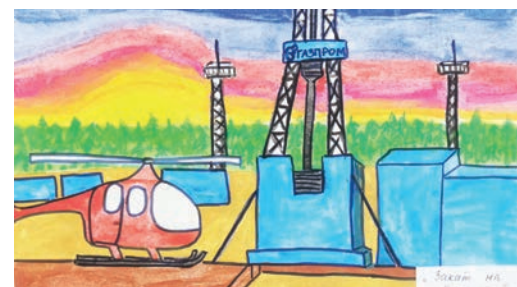
Одна из творческих работ конкурса «Ковыкта — таежный край»

графии с трассы и карту проезда по 10-километровому маршруту с GPS-трекера. Все участники велопробега получили медали.