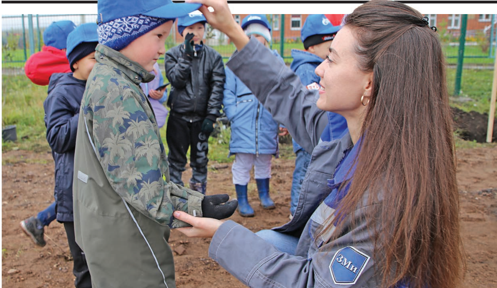
Во время высадки «Аллеи газовиков» в селе Тутура 2 сентября. Репортаж о мероприятии — на странице 3