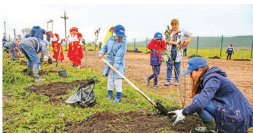
Школьники активно помогли старшим в обустройстве аллеи

Идея обустроить «Аллею газовиков» в Жигаловском и Казачинско-Ленском районах, где расположены производственные объекты Ковыктинского газоконденсатного месторождения (ГКМ), возникла у сотрудников отдела охраны окружающей среды «Газпром добыча Иркутск». Совместно с профсоюзной организацией был подготовлен экологический проект, который весной этого года стал победителем конкурса «Газпром профсоюза» по направлению «Мероприятия в сфере экологического добровольчества» и получил финансирование. К реализации проекта подключились наши коллеги из Некоммерческого партнерства «Газпром на Байкале». В частности, площадку для аллеи рядом со школой в Тутуре