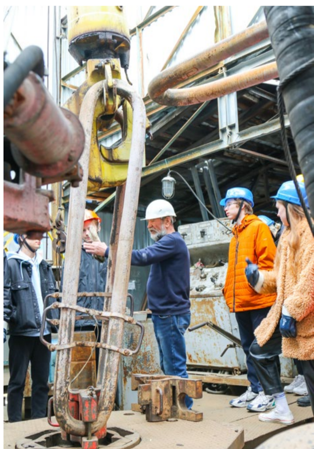
Ни одного ученика иркутского «Газпром-класса» экскурсия на экспериментальную буровую установку ИРННТУ не оставила равнодушным