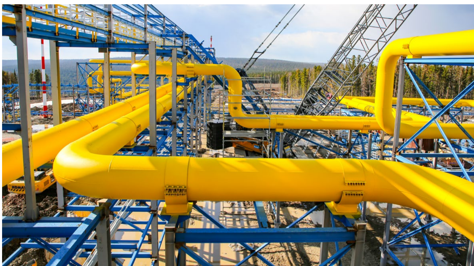
На площадке строительства установки комплексной подготовки газа УКПГ-2 Ковыктинского месторождения