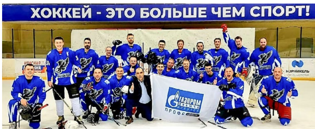
Хоккеисты «Газпром добыча Иркутск» объединились в команду «Ястребы». Парни участвуют в кубке, посвященном Дню России

офиса «Ковыкта» включает в себя соревнования по многим видам спорта — стритболу, волейболу, футболу, легкой атлетике, плаванию, шахматам и гиревому спорту. Все соревнования пройдут в течение лета, а закрытие запланировано на начало сентября.