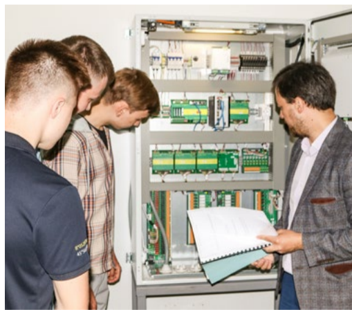
Студенты ИРНТУ знакомятся со стендом

«Газпром добыча Иркутск» заинтересован в том, чтобы будущие специалисты знали и умели работать с программно-тех-