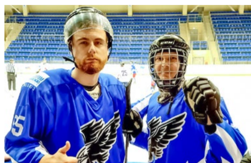
ДОСТОЙНЫЕ РЕЗУЛЬТАТЫ СТР. 3