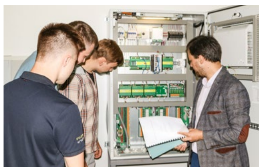
В ПОМОЩЬ СТУДЕНТАМ СТР. 2