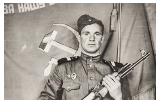
НАША ПОБЕДА. МОЯ ИСТОРИЯ СТР. 4