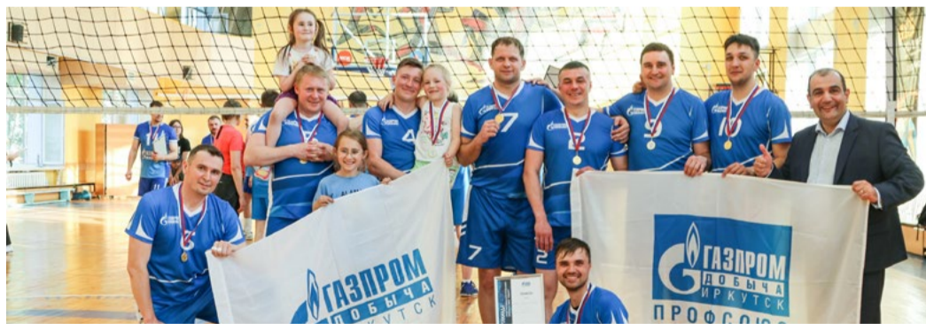
20—22 мая в рамках спартакиады интегрированного проектного офиса «Ковыкта» состоялся волейбольный турнир. Мужская команда заняла в нем первое место

Стоит отметить, что I спартакиада среди участников интегрированного проектного