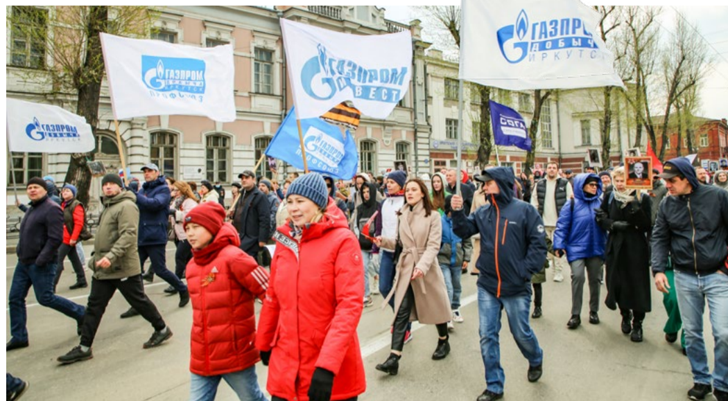
Работники «Газпром добыча Иркутск» и других компаний Некоммерческого партнерства «Газпром на Байкале» во время праздничного шествия 9 Мая

Тем не менее, вспоминая о поисковых работах, он с трудом сдерживает волнение.