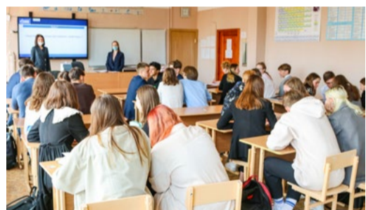
6 мая в «Газпром-классе» работники компании провели викторину, посвященную Дню Победы

Профсоюзная организация провела для сотрудников компании и их детей конкурсы открыток и видеопоздравлений «В День Победы хочу пожелать я...» и конкурс фотогра-